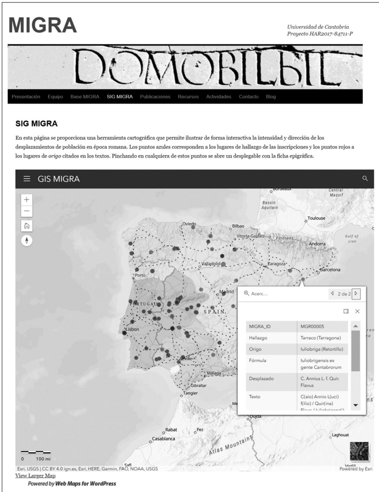
Figura 4. Servidor de mapas del SIG MIGRA accesible desde la web

«diseño de un modelo conceptual, implementación del modelo, construcción de una interfaz externa y decisión sobre el sistema para almacenar físicamente los datos» (Conolly y Lake, 2009, 87). En la práctica el primer paso en el diseño de la base de datos del proyecto